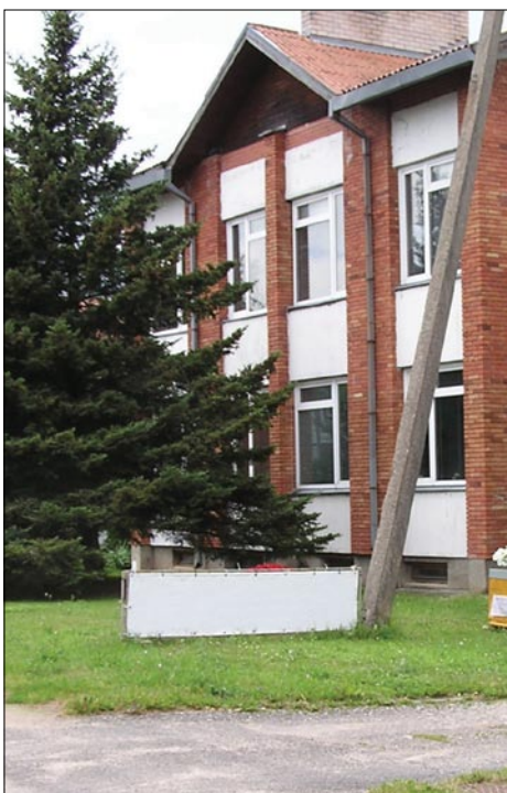
Svėdasų bendruomenės namai