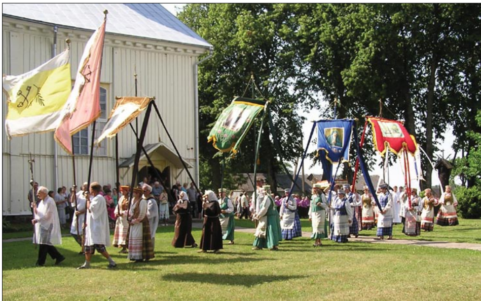
Šv. Petro ir Povilo atlaidų procesija prie Svėdasų bažnyčios