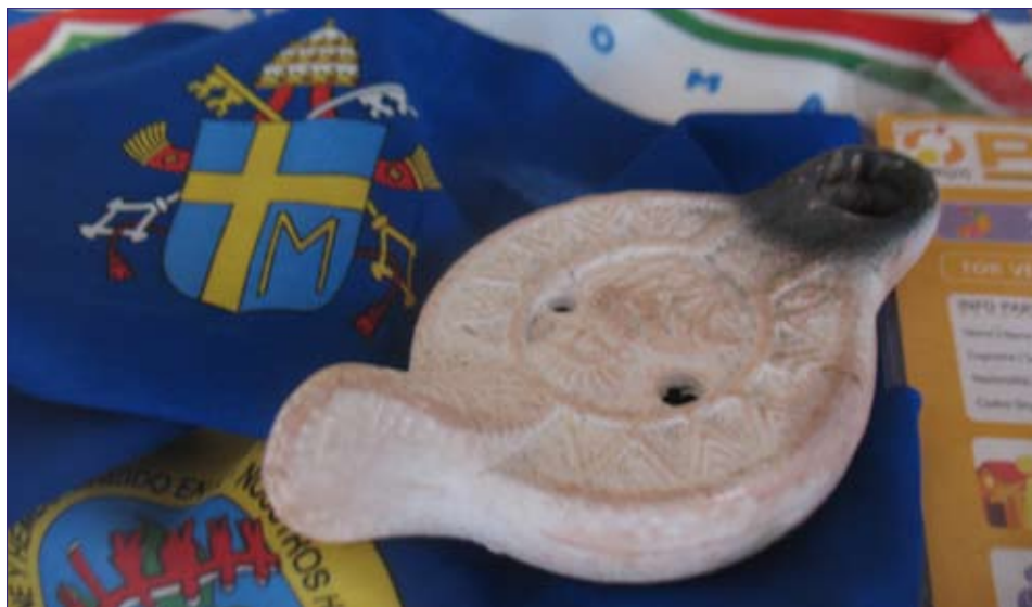
Jubiliejinių krikščionybės 2000 metų keliautojo į Romą krepšio puslapyje – spalvinga, simboliškai papuošta skara ir laivėlio formos žvakidė.

Trumpai aptarta ir paroda „Iš piligrimo krepšio“, kurioje eksponuojami daiktai išsaugoti po kelionės jubiliejinių 2000 metų rugpjūtį į Romą, Asyžius, Paduvą, Veneciją ir kitas nuostabiosios Italijos vietas. Ten ir bambuko lazda iš Tarvergatos dykynės, kurioje XV jaunimo dienos susitikime su Šventuoju Tėvu ir pamaldose dalyvavo apie du milijonus piligrimų iš viso pasaulio, skara, kepuraitė, knygos, žemėlapiai, paveikslėliai, kriauklė iš Tirėnų jūros, ir bilietas įkopti į Šv. Petro bazilikos kupolą ir dar daug kitų įdomybių. Paroda veiks iki pat Šv. Velykų švenčių.