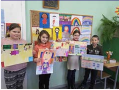
Konkurso „Knygų namų šviesa“ dalyviai

2016-aisiais metais Anykščių r. Svėdasų Juozo Tumo-Vaižganto gimnazijos biblioteka organizavo bibliotekų metams skirtus renginius. Mokiniai dalyvavo Lietuvos vaikų neformaliojo švietimo centro organizuojamose veiklose: ketvirtokai – meninės kūrybos konkurse „Knygų namų šviesa“, penktokai įsitraukė į pilietinę akciją „Mano nuveikti darbai bibliotekoje“. Pradinių klasių ir II gimnazijos klasės mokiniai buvo išvykę į Anykščių rajono savivaldybės Liudvikos ir Stanislovo Didžiulių viešąją biblioteką, kurioje susipažino su jos veikla bei apsilankė „Katino svetainėje“.