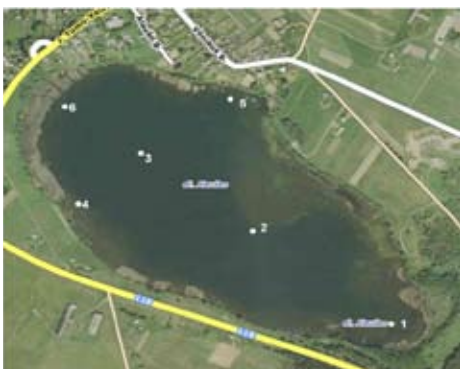
Alaušo ežero mėginių ėmimo schema

Alaušo ežeras užima 50,1 ha plotą. Jo ilgis apie 1150 m, didžiausias plotis 480 m. Iš ežero išteka upelis Alauša (kai kuriuose žemėlapiuose – Svėdasa) teka per miestelį ir įteka į Beragio (Svėdaso) ežerą <...> 2005 m. birželį atlikus žemės