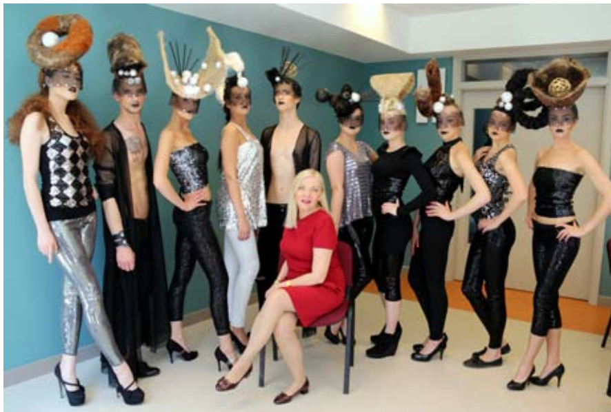
Grožio krypties programose besimokantys mokiniai tarptautiniame renginyje „Baltijos šalių dienos“ pristatė savo kolekciją „Ateities grožio projekcijos“