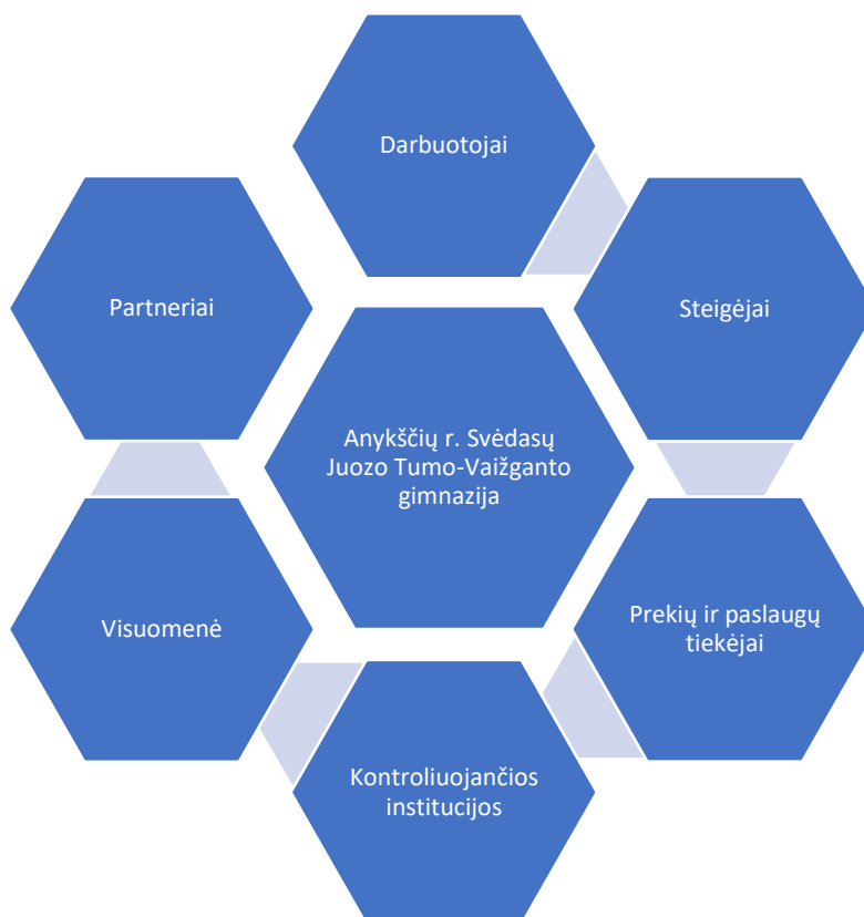
1 pav. Suinteresuotų šalių grupės

4.1.4.1. informacijos naudojimas – įstaiga gauna, rengia ir naudoja aktualią, išsamią, patikimą ir teisingą informaciją, atitinkančią jai nustatytus reikalavimus ir palaikančią vidaus kontrolės veikimą.